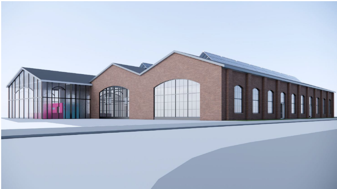
Abbildung 4: Perspektive der Markthalle mit Neubau, Architekturbüro Sven Scholz